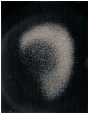
Leverscan rechtslateraal na een week

Voorgeschiedenis en beloop maakten duidelijk dat hier sprake was van een amoebenabces van de lever.